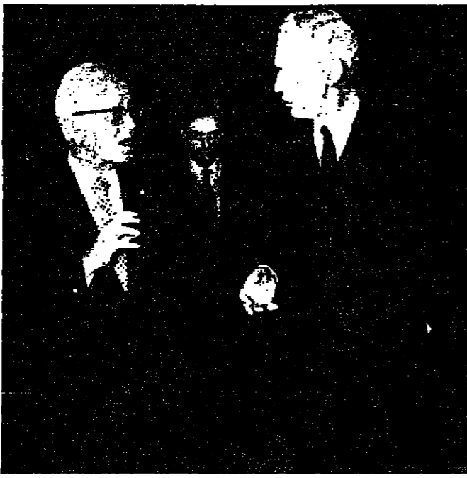
الرئيس فريجة والمبعوث الفرنسي كوف دوموريل

وبعد مضي ساعة ونصف انضم الى الاجتماع ممثلون من الاحزاب والهيئات القومية ، وقد جرى خلال الاجتماع مناقشة تطورات الوضع الداخلي والتزامات القيادة السياسية بتفاهات وقف النار والمساهمة في تهيئة الاجواء في سبيل اعادة الامن الى البلاد . وبعد انتهاء الاجتماع قال السيد صلاح خلف « ابو ابيد » : اكننا لرئيس الحكومة من جديد موقفاً القويمة الفلسطينية ، وانه بينما وقفنا القتال دون قيد او شرط ، وهذا كان موقفنا القويمة منذ الاساس ولم يتبدل ، ونحن ضد العنف كوسيلة - البقية على ص ٦ عمود ٨ -